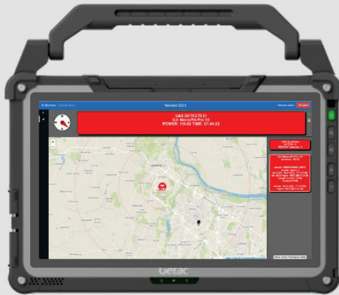
MAKSİMUM ESNEKLİK İÇİN TARAYICI TABANLI HMI