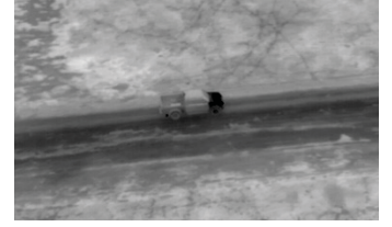
Mantis i45 N'den Bir Görüntü