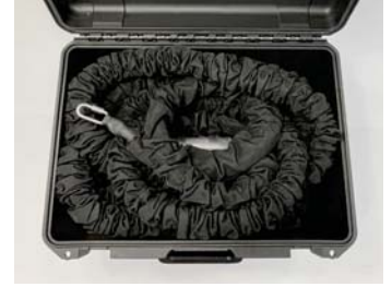
BFS Taşıma Çantası