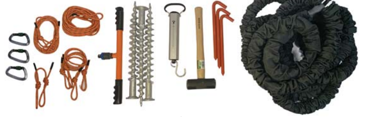
Bungee Fırlatma Sistemi Bileşenleri