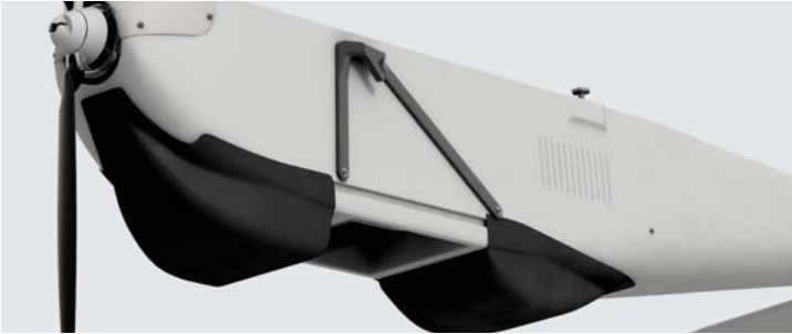
Puma™ 2 AE ve Puma™ 3 AE Montaj Aparatı

* Sakin rüzgâr koşullarında. Kuyruk rüzgârı varken fırlatma yapılması önerilmemektedir.