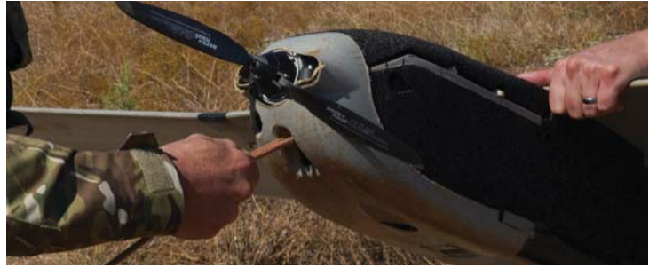
Puma™ LE Montaj Aparatı

Kızılırmak Mah. 1446. Cad. No: 12/18 Çukurambar 06530 Çankaya, Ankara / TÜRKİYE Tel : +90 (312) 284 30 12 (PBX) Faks : +90 (312) 284 30 14 altoy@altoy.com.tr www.altoy.com.tr